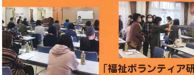
「福祉ボランティア研修会」